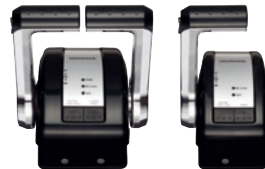
HONDA iST (DBW) (TWIN)

Die neuen BF115-350 DBW Modelle können mit 3 verschiedenen Schaltsystemen bestellt werden, Honda DBW (Single), Honda DBW (Twin) und Honda Seitenmontage verdeckt (nicht abgebildet). Die Vorteile: Keine Schaltkabel, verzögerungsfreie Schalt- und Gasbetätigung, Ausfallsicherheit durch 2 Datenabgleichssysteme. Das DBW bietet alle Eigenschaften, die sich Bootsfahrer wünschen, einschließlich schnellem Leerlauf, Trolling Steuerung und Motordrehzahl sowie Trimm synchronisation (bis zu 4 Motoren).