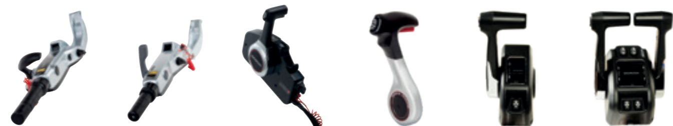
MULTIFUNKTIONS-STEUERPINNE (BF60A & BFP60A)

Die ergonomisch gestalteten Pinnen und Fernbedienungen ermöglichen eine präzise und mühelose Kontrolle.